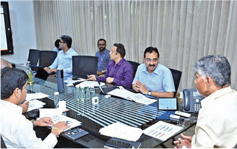
మంగళవారం మైనింగ్ శాఖపై సమీక్ష జరుపుతున్న సిఎం చంద్రబాబు