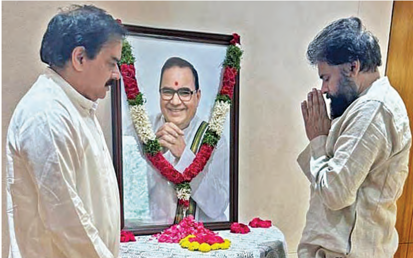
దినంత మాజీ సిఎం నాదెండ్ల భాస్కరరావుకు మంగళవారం నివాళి అర్పిస్తున్న డిసిఎం పవన్ కళ్యాణ్